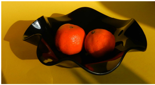
Schalen mit einzigartigen Formen