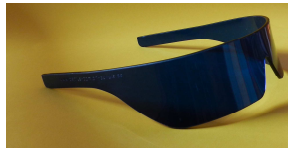
Unsere Designerbrille Für coole Typen!