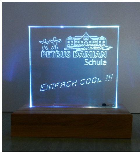
Pokale - beleuchtet und unbeleuchtet