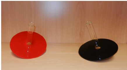
Verschiedenes: z.B. „Diemelsurfer“